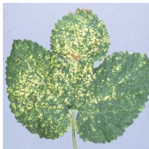
Symptômes Hop mosaic Virus