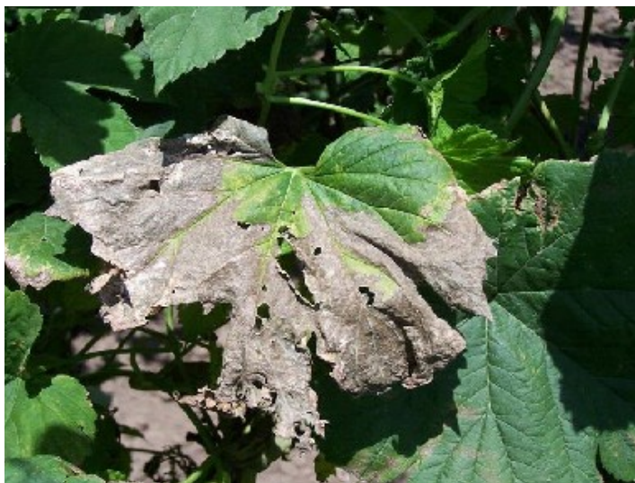
Symptômes sur feuille et tige de Verticillium albo-atrum