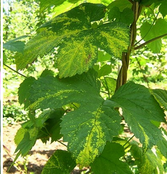
Symptômes de Hop Stunt Virus