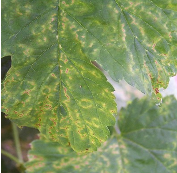
Symptômes d'Apple Mosaic Virus