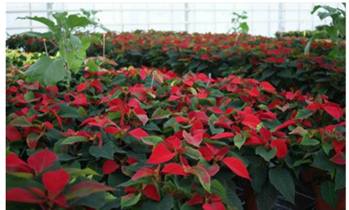
vue d'ensemble d'une culture de poinsettia avec aubergine comme plante piège des aleurodes

En effet à une température de 16°C, la durée du cycle de Bemisia dépasse les 130 Jours contre à peine 60 pour Trialeurodes .