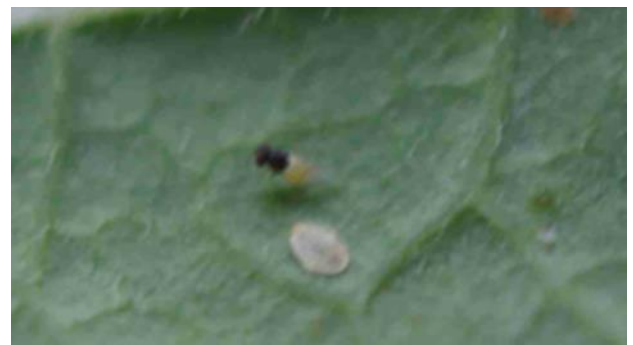
Encarsia formosa face inférieure d'une feuille de poinsettia