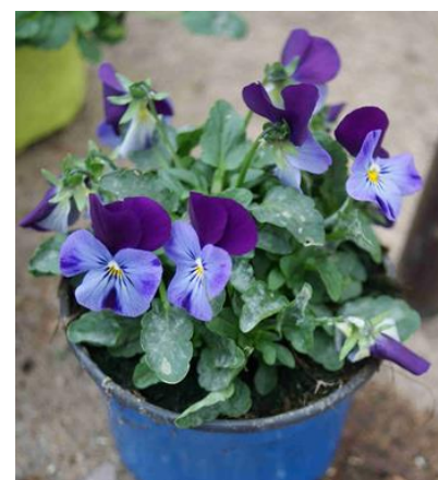
Photo ci-contre Est Horticole : feutrage blanc à la face supérieure des feuilles caractéristique de l'oïdium.

Il ne faut pas hésiter à ventiler et ouvrir les serres et abris afin de limiter l'humidité favorable au développement des maladies cryptogamiques.