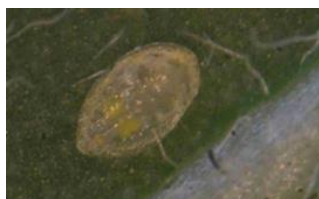
Photo Est Horticole puparium de Bemisia tabaci