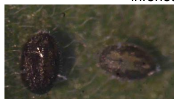
pupariums de Trialeurodes vaporariorum parasités