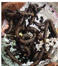
Larves de tipule