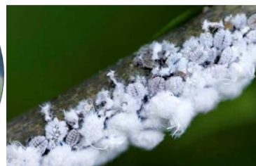
Pucerons laineux du frêne

Pucerons sur hortensia et hêtre et acariens sur rosier et