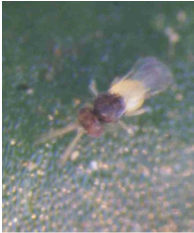
Encarsia formosa face inférieure d'une feuille de poinsettia

L'installation de pieds d'aubergine dans les cultures de poinsettia permet de concentrer les aleurodes sur les feuilles d'aubergine et de garder les poinsettias propres.