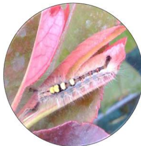
Une chenille d' Orgyia antiqua