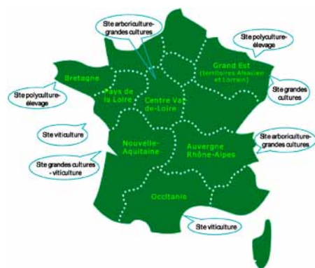
Fig 1 : Carte de présentation des sites de mesures RePP'Air

RePP'Air, porté par la Chambre Régionale d'Agriculture Grand Est, regroupe de multiples partenaires: 7 Chambres Régionales d'Agriculture, 5 Chambres Départementales d'Agriculture, 7 AASQA, 3 organismes de recherche et 9 établissements de formation agricole. RePP'Air vise à affiner la compréhension des phénomènes impliqués dans les transferts de produits phytosanitaires vers l'air et intégrer cette question dans le conseil agricole. L'étude s'appuie sur 8 sites de mesures répartis dans 7 régions (fig 1), dont un en Alsace et un en Lorraine, où la même démarche sera appli-