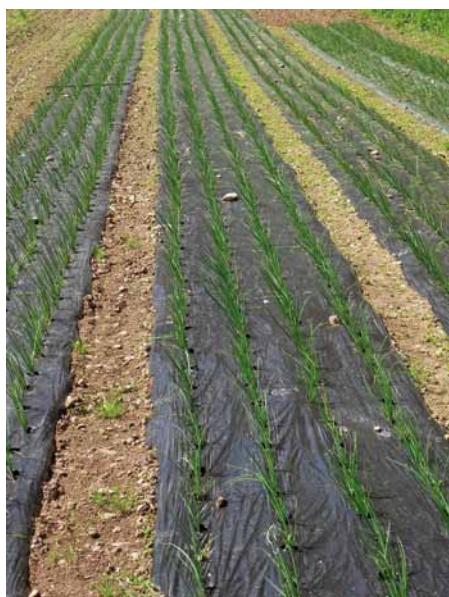
Paillage d'une culture d'oignons.

Le bon fonctionnement de ce dispositif et les résultats encourageants obtenus ont permis le renouvellement de DEPHY Ferme. Ainsi, pour la période 2016-2021 la quasi majorité des agriculteurs s'est réengagée tandis que de nouveaux les ont rejoint. Les filières Horticole et Pépinière du Grand Est, jusqu'alors non représentées sont notamment venues enrichir le réseau. Désormais, ce ne sont pas moins de 27 groupes rassemblant plus de 320 exploitations qui composent le dispositif DEPHY du Grand Est. Avec des partenaires de tous horizons : Chambres d'agriculture, Coopératives, FREDON, CETA, CIVAM, OPABA, AREFE ainsi qu'EST HORTICOLE.