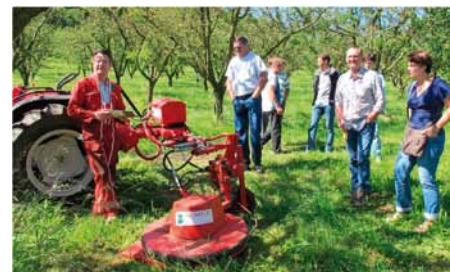
Entretien mécanique des vergers.

Arboriculture : La production de prunes et en particulier de mirabelles est une spécificité territoriale représentée par un unique groupe lorrain. La forte hétérogénéité des évolutions enregistrées conduit à une diminution générale de 6 %. Le travail a été principalement axé sur les recours aux méthodes de biocontrôle et