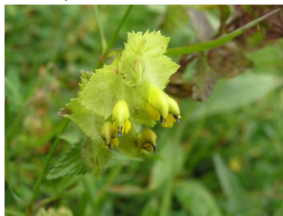
Rhinanthe crête-de-coq : Rhinanthus alectorolophus , Orobanchaceae