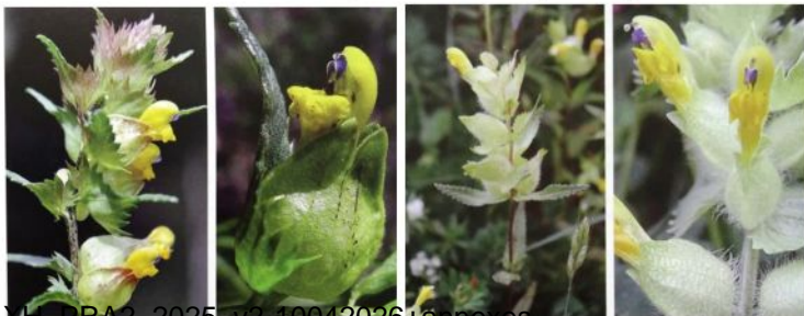
Rhinantes (toutes les espèces)