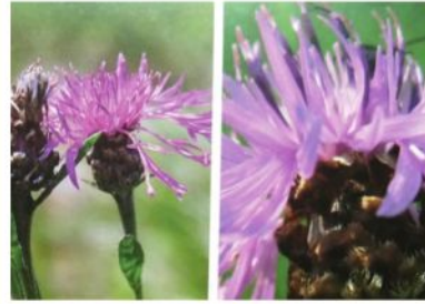
Centaurées ou sératules