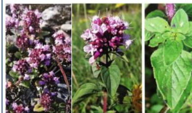
Thyms (toutes les espèces) ou origans