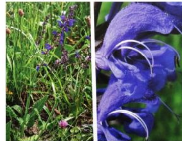
Sauges (toutes les espèces)