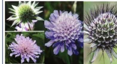
Knauties, Scabieuses ou Succises