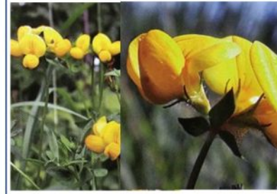
Lotiers (toutes les espèces)