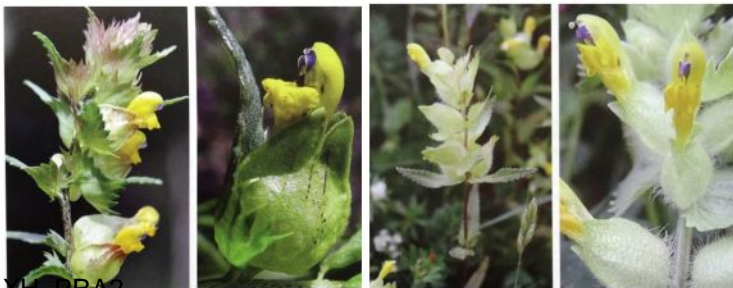
Rhinantes (toutes les espèces)