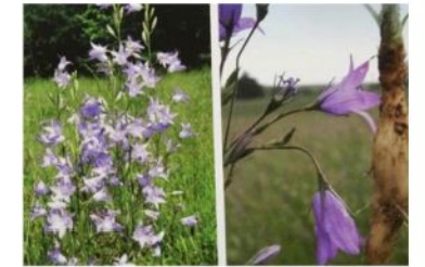
Campanules (toutes les espèces)