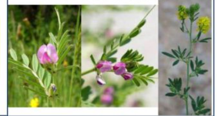
Gesses (toutes les espèces), Vesces (toutes les espèces), Luzernes sauvages