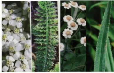
Achillées , Fenouils (toutes les espèces)