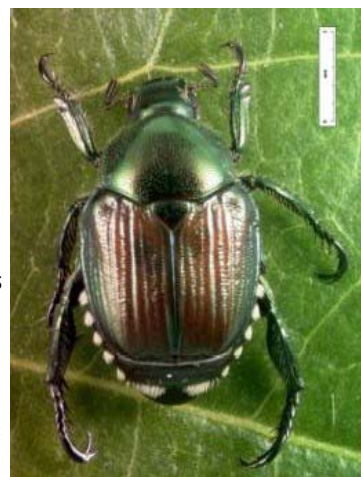
Figure 1 - Adulte Popillia japonica

Popillia japonica peut être confondu avec d'autres coléoptères présents en France, notamment avec le hanneton des jardins ou hanneton horticole. Toutefois, il est facilement reconnaissable par la présence de touffes de soies blanches sur le pourtour de l'abdomen (cf. figure 1).