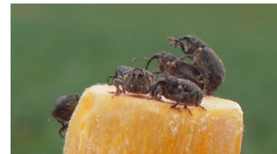
Les charançons du bourgeon terminal sont présents dans les parcelles et prêts à pondre

Les petits colzas présentent les risques les plus importants, avec une migration des larves vers le cœur des plantes nettement plus aisée que dans des plantes développées.