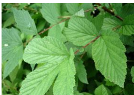
Reine des prés