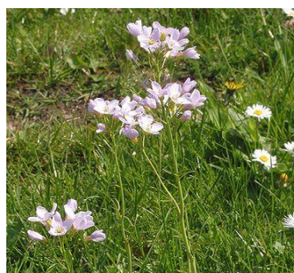
Cardamine des prés