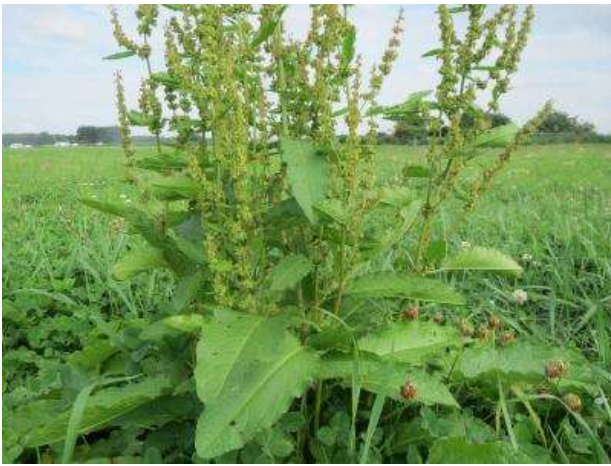
Le Rumex à feuilles obtuses : c'est un gros rumex aux feuilles très larges (favorisé par l'excès de fumier mais aussi malheureusement par les dégâts de sanglier)