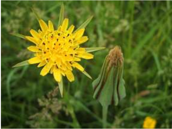
Salsifi : grande fleur jaune