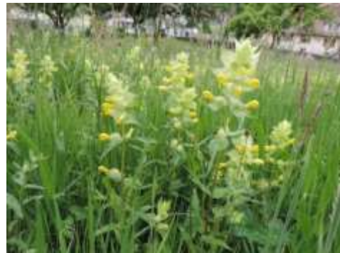
Rhinante ou crête de coq : prairies maigres