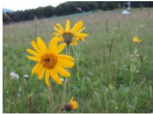
Arnica : prairies d'altitude et hautes chaumes non fertilisées