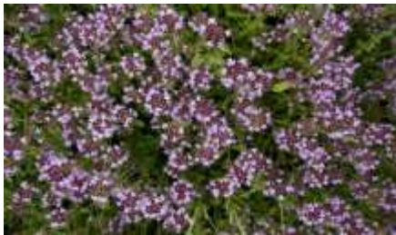
Thymus serpolet, origans : pâtures sèches, rocailleuses, souvent plein sud.