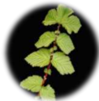
Reine des prés : grande plante (1 m) - en fleur à gauche, avec ses feuilles composées caractéristiques, à droite. Plante des zones humides, parfumée, avec souvent beaucoup d'insectes butineurs.