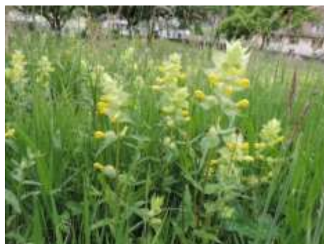
Rhinante ou crête de coq : prairies maigres