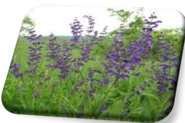
Sauge : grandes fleurs, prairies de fauche peu amendées, plutôt à basse altitude et sur calcaire