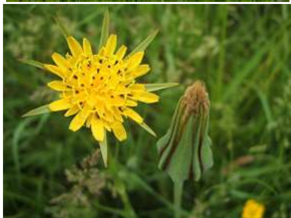
Salsifi : grande fleur jaune