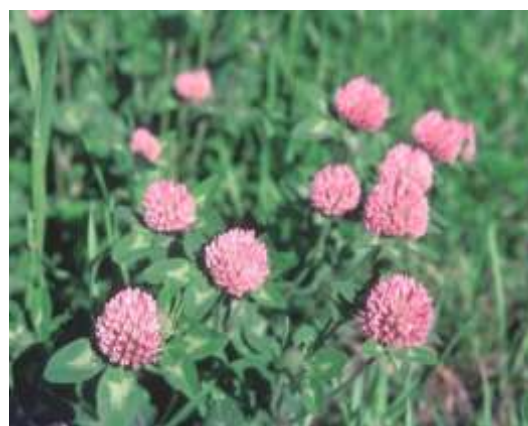
Trèfles (violet ou blanc)