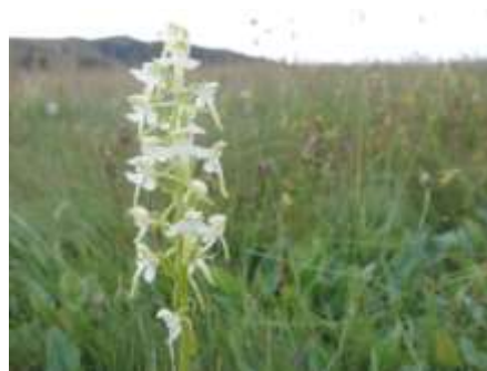
Orchidées : nombreuses espèces différentes, en terrain maigre