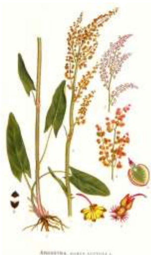
Rumex : oseille, petite oseille feuilles en fer de lance, fleurs rougeâtres