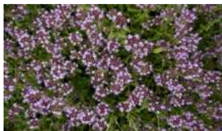
Thyms serpolet, origans : pâtures sèches, rocailleuses, souvent plein sud.