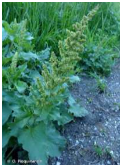
Le Chénopode bon-Henri , cousin de l'épinard

De manière à conserver la qualité agronomique des prairies et s'assurer d'apports azotés compatibles avec l'expression d'une bonne biodiversité, il pourra être vérifié que ces espèces ne prennent pas une part importante dans les prairies engagées.