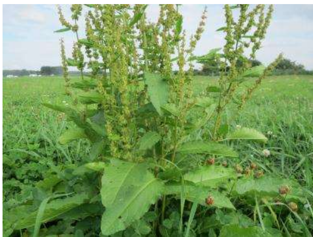
Le Rumex à feuilles obtuses : c'est un gros rumex aux feuilles très larges (favorisé par l'excès de fumier mais aussi malheureusement par les dégâts de sanglier)