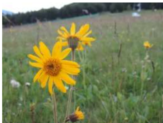
Arnica : prairies d'altitude et hautes chaumes non fertilisées