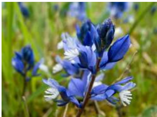
Polygala : fleurs bleues, rarement roses, sur prairies pâturées exposées au sud, non fertilisées