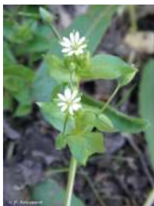
Mouron des oiseaux : petites plantes que l'on trouve aussi dans les potagers, aux fleurs blanches

Il s'agit de plantes opportunistes, favorisées par l'apport azoté issu des engrais organiques ou minéraux. Ces plantes, dégradent la qualité fourragère de la prairie car elles sont peu consommées par le bétail. Elles sont souvent localisées autour des zones de dépôts de fumier / compost mais peuvent, dans des cas extrêmes de fertilisation, prendre une part importante de la flore.