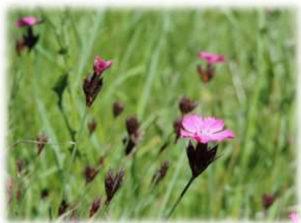
Oeillets : fleurs aux tons roses, sur prairie sèche exposée sud