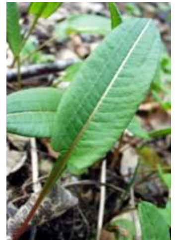
Renouée bistorte : fleurs en écouvillon rose, feuilles allongées qui se prolongent sur le pédoncule, prairies plutôt fraîches à humides.