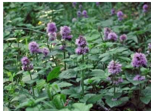
Menthe : reconnaissable à son odeur, plante de milieu humide, fleurs roses en épis terminal