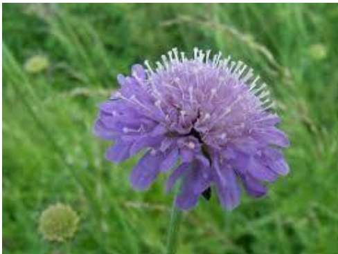
Knautie (haut et bas)

Les knauties, ou scabieuses, sont présentes majoritairement en prairie sèche. Les feuilles des knauties sont très découpées (de plus en plus à mesure que l'on s'éloigne de la base) et velues, de couleur bleu-gris. Les fleurs sont bleues-violettes. A l'inverse, les succises préfèrent les terrains humides. Elles ont des feuilles basale ovales ou lancéolées, et fleurissent également violet. Elles sont indicatrices de milieux pauvres.