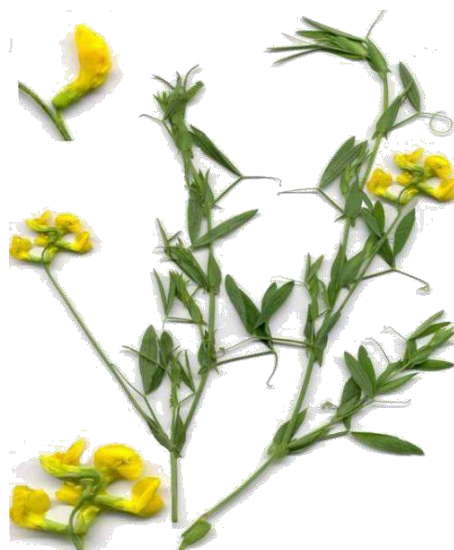
Gesse des prés