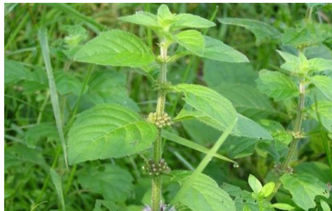
Menthe des prés

Les menthes et les reines des prés se développent toutes dans des prairies humides. Si l'odeur de la menthe est facilement reconnaissable, la reine des prés se reconnaît principalement grâce à sa tige rouge, paraissant ligneuse au premier coup d'œil. De loin, on pourrait la confondre avec une ronce. Une fois fleurie, on distingue facilement son ombelle blanche.