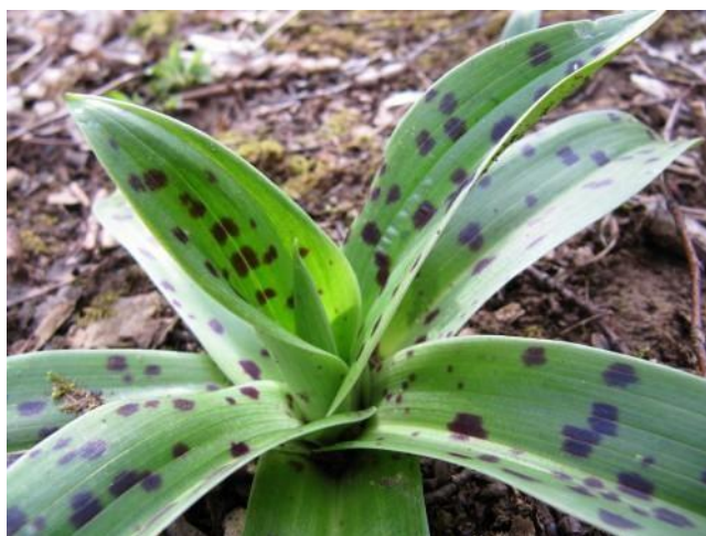
Flours et feuilles d'orchidées

ATTENTION : la confusion est facile entre les orchidées et les colchiques. 2 critères sont à vérifier :