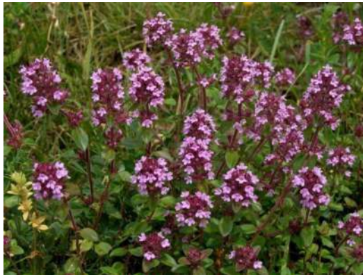
Serpolet petit chêne

Les thyms et les origans ne poussent que dans les prairies très sèches. On les reconnaît facilement par leur odeur, identique aux herbes utilisées en cuisine. Les espèces que l'on retrouve le plus dans les Vosges sont le serpolet petitchêne et l'origan commun.