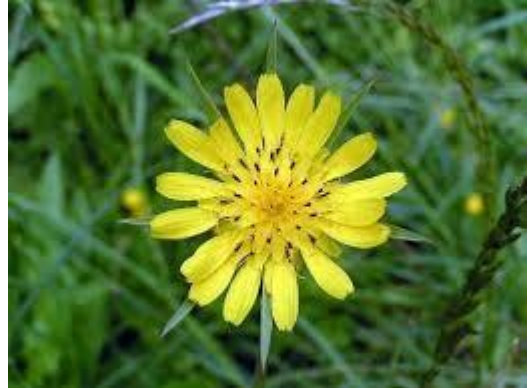
Fleur de salsifi

ATTENTION : la confusion avec un crépis ou un laiteron est possible. Les feuilles du salsifis ressemblent plus à des feuilles de graminées qu'à des feuilles de pissenlit.