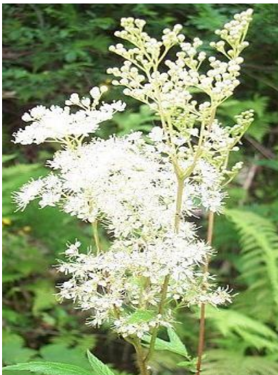
Fleur de reine des prés