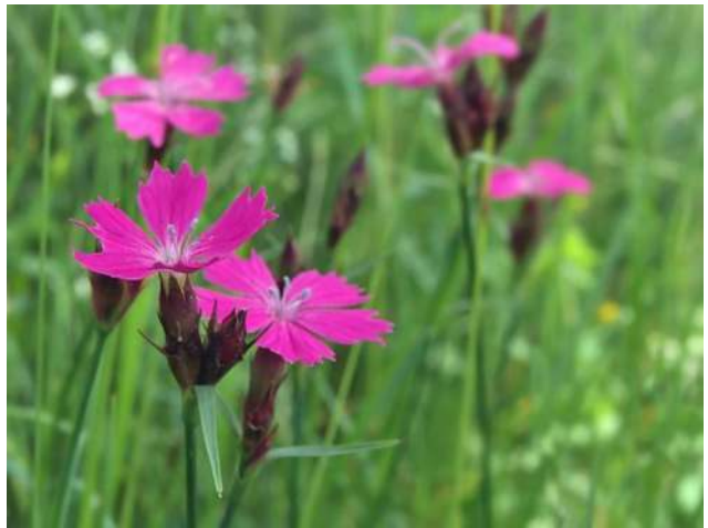
Œillet des chartreux