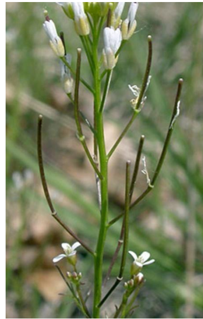
Cardamine en fleur (gauche) et en silique (droite)