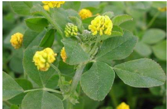
Luzerne lupuline ou minette

ATTENTION : un trèfle, appelé trèfle douteux, ressemble énormément à la minette. Il fleurit également jaune. La seule différence est l'absence de mucron au bout des folioles, alors qu'il est forcément présent chez la minette.