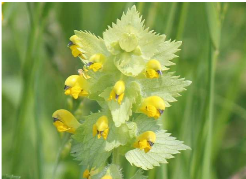
Rhinante velu (milieu sec)