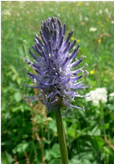
Raiponce en épi

Les raiponces, quoi que peu présentes dans la plaine des Vosges, peuvent toutefois être retrouvées dans des terrains très pauvres et exploités de manière particulièrement extensive. La fleur est très reconnaissable par ses pétales soudés en pointes au sommet et ouverts à la base. Sur la raiponce en épi, l'espèce la plus présente en Lorraine, la feuille en forme de cœur présente souvent une tache à la base.