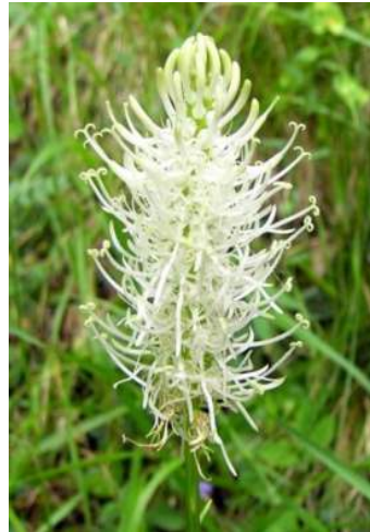
Raiponce en épi