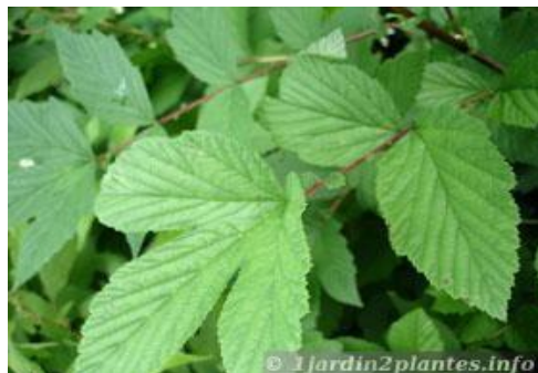
Feuille de reine des prés