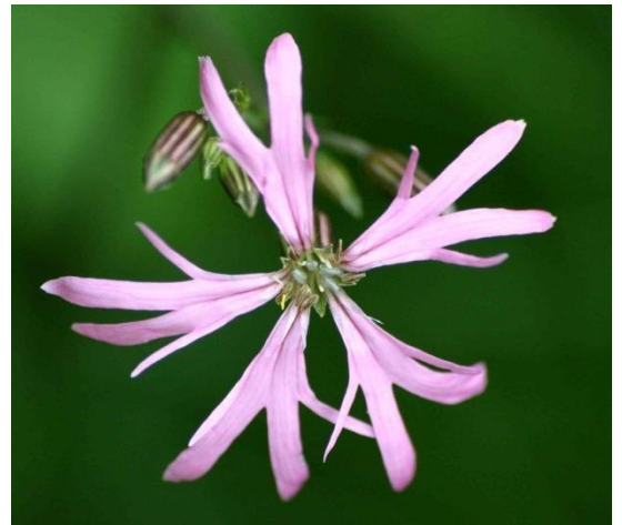
Silène fleur de coucou