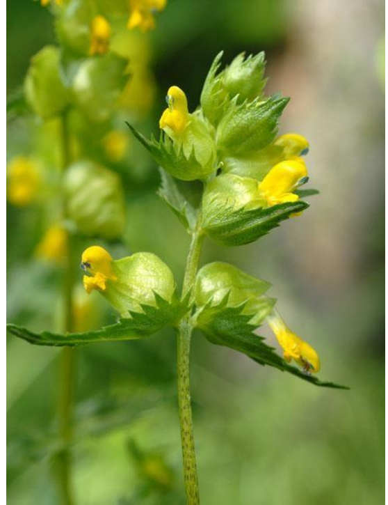
Petit rhinante (milieu humides)

Le rhinante pousse dans des prairies peu riches. Il existe 2 espèces de rhinantes dans les Vosges. L'une, velue, pousse dans des zones plutôt sèches tandis que l'autre, glabre, préfère les milieux plutôt humides.