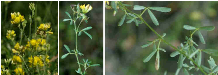
Daniel K Source : Tela Botanica