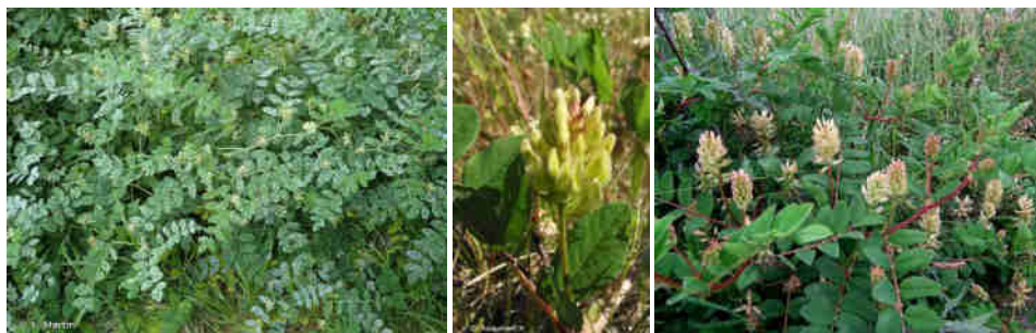
Y. Martin Source : INPN