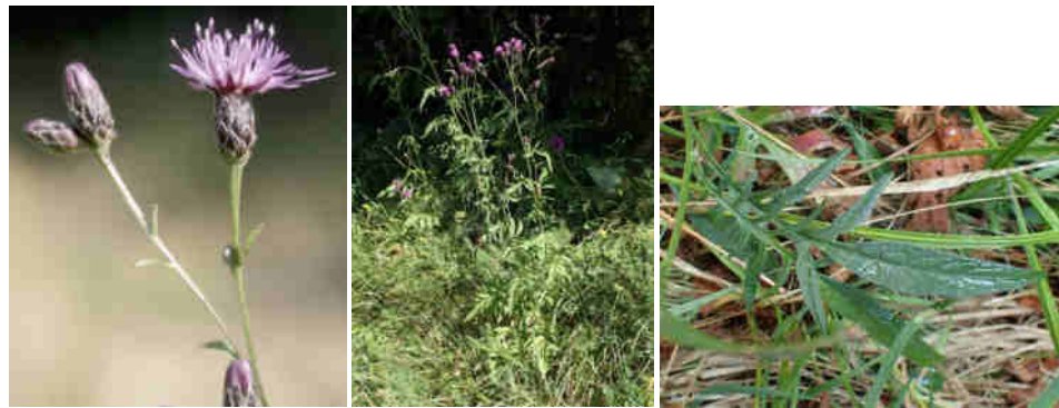
Serratule des teinturiers