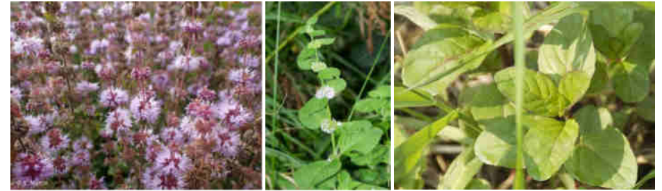
Y. Martin Source : INPN