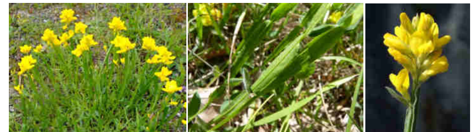
J.-P. Cazes Source : Tela Botanica