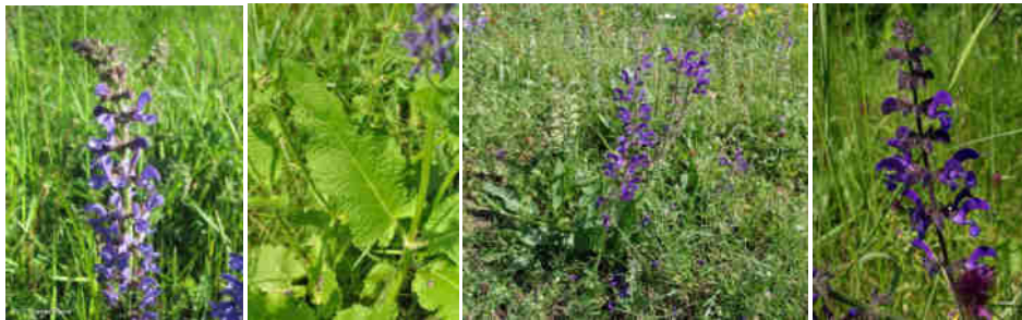
C. Lenormand Source : INPN