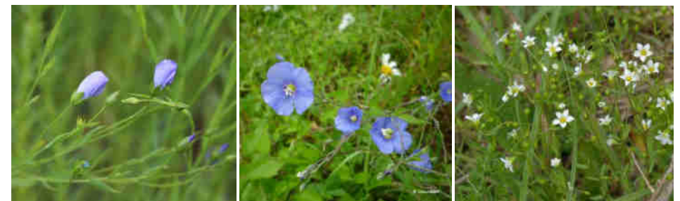
O. Roquinarc'h Source : INPN