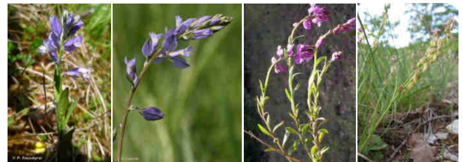
P. Rouveyrol Source : INPN