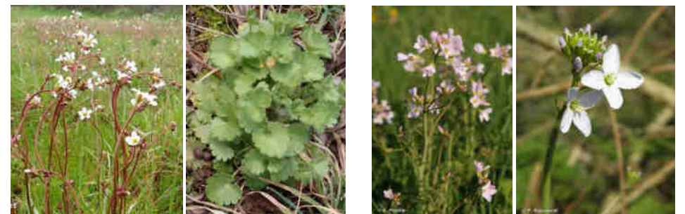
R. Poncet Source : INPN