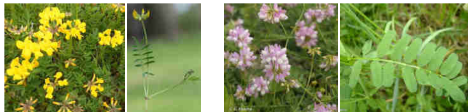
D. Rемаud Source : Tela Botanica