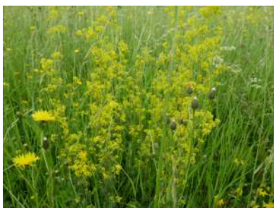
Galium gr mollugo