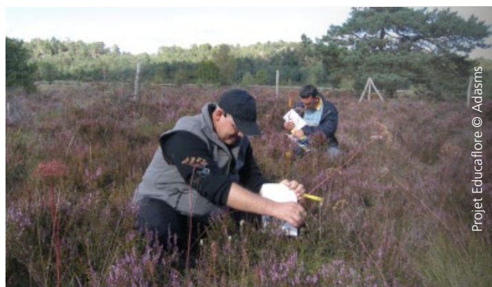
Projet Educaflores