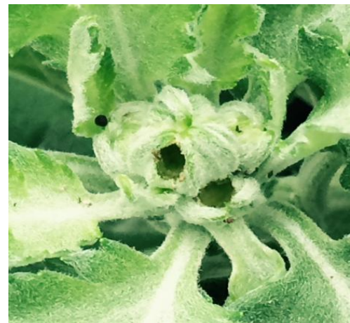
Trou dans un bouton floral de chrysanthème dû à une chenille

Très polyphages et voraces, ces chenilles se sont également installées dans le feuillage des cyclamens