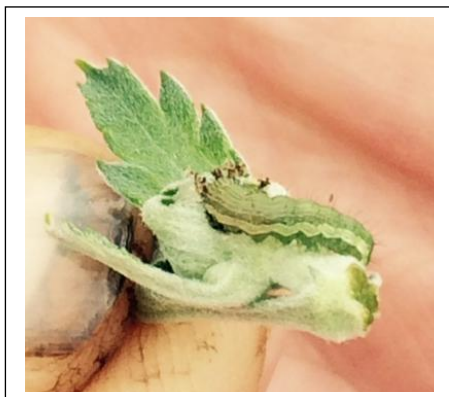
Noctuelle responsable des dégâts dans le bouton