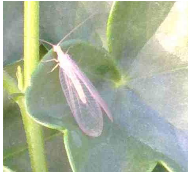
Chrysope sur pélargonium

La présence d'auxiliaires naturels est observée même dans les serres maintenues hors gel en hiver.