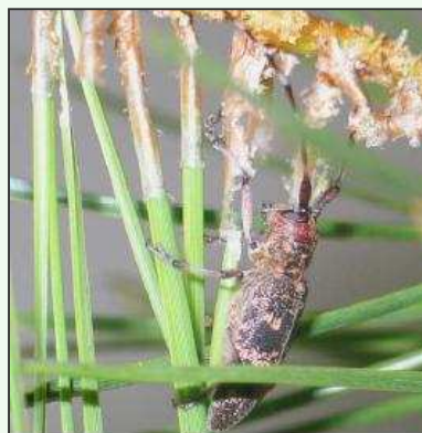
Femelle de Monochamus galloprovincialis .