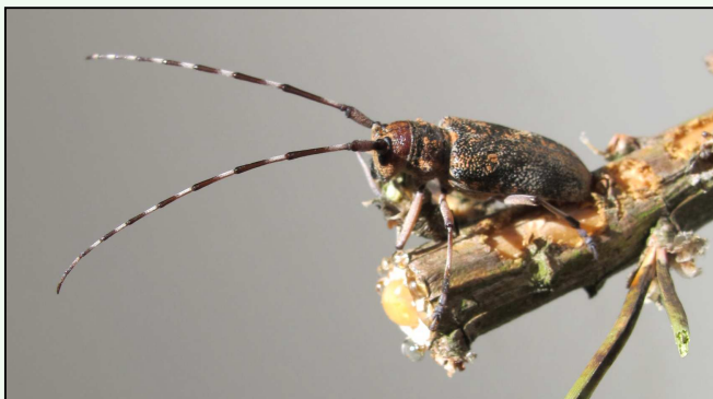
Femelle de Monochamus galloprovincialis et trace de repas de maturation sur rameau

Sans vecteur, les nématodes ne peuvent pas passer d'un arbre à un autre. Les espèces de coléoptères longicornes du genre Monochamus sont vectrices quasi exclusives du nématode et permettent leur transmission d'un arbre contaminé à un arbre sain. Cette transmission est assurée systématiquement par les espèces autochtones (principalement M. alternatus au Japon, M. carolinensis en Amérique du Nord et M. galloprovincialis en Europe). La plupart des Monochamus inféodés aux conifères sont associés à de nombreuses espèces de Bursaphelenchus non pathogènes (comme B. mucronatus en Europe et en Asie) mais dans les zones d'introduction B. xylophilus se révèle plus compétitif et se substitue aux nématodes locaux.