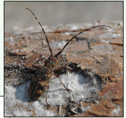
Femelle de Monochamus galloprovincialis émergeant d'un tronc

Le vol de l'insecte correspond donc à la phase de dispersion et d'inoculation du nématode. Comme les adultes de Monochamus vivent plusieurs semaines, ils sont capables d'effectuer des vols de plusieurs centaines de mètres voire plusieurs kilomètres, en réalisant probablement des repas fréquents sur plusieurs arbres. Les blessures correspondantes sont autant de portes d'entrée pour le nématode qui quitte les trachées pour pénétrer dans l'aubier. Comme l'insecte se nourrit de l'écorce des pousses de 1 à 3 ans, les nématodes se développent principalement au niveau des houppiers.