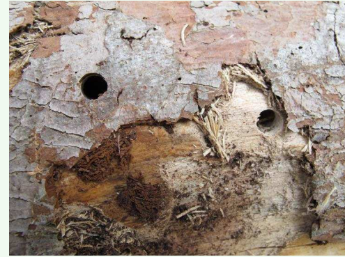
Trous de sortie des adultes, toujours circulaire (4-10 cm)

2-3 semaines après l'éclosion, les larves sillonnent la surface de l'aubier et font de vastes plages sous corticales à lobes larges. De longs copeaux de bois sont expulsés en grande quantité. À partir de la 6 ème semaine, la larve fore une galerie ovale dans le bois. Le trou de pénétration se trouve sur les bords des plages sous corticales.