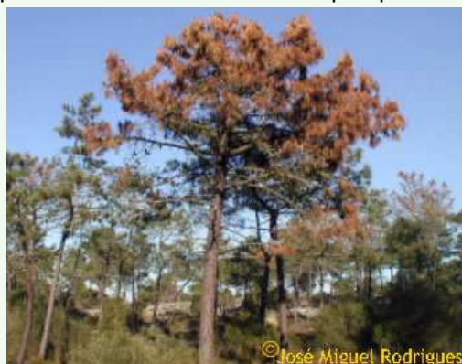
Dépérissements de Pinus dus au nématode du pin.

La multiplication des nématodes, dans l'arbre, provoque progressivement la rupture du transport de l'eau dans le xylème ce qui se traduit par un jaunissement puis un flétrissement généralisé des aiguilles. L'arbre meurt rapidement tout en étant attaqué par les insectes sous corticaux.