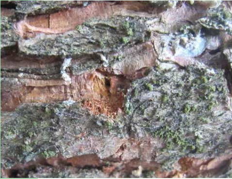
Encoche de ponte : la femelle dépose ses oeufs

Lors de la ponte, les Monochamus creusent des encoches transversales dans l'écorce. En retirant l'écorce, on peut observer les larves qui creusent leurs galeries de nutrition dans l'aubier. Des orifices arrondis avec ou sans écorce marquent la sortie des insectes.