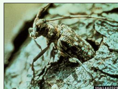
Emergence d'un adulte Monochamus alternatus .

Les œufs de Monochamus , pondus dans les encoches réalisées par la femelle dans l'écorce des branches d'arbres affaiblis, éclosent en 4 à 12 jours. Les larves s'alimentent en été du phloème et du cambium, puis entrent en nymphose dans le bois. C'est au cours de cette nymphose que les nématodes, s'ils sont présents dans le bois, se fixent dans les trachées des insectes. Les adultes émergent du bois l'année suivante et se dispersent dans les peuplements tout en consommant l'écorce de jeunes rameaux d'arbres sains. C'est pendant cette phase, dite de maturation sexuelle, qu'ils inoculent les nématodes dans les arbres sains. Après l'accouplement, les femelles sont attirées par les arbres affaiblis, notamment ceux atteints par les nématodes, mais aussi les troncs récemment abattus sur lesquels elles pondent. Une génération par an est habituelle mais le développement peut prendre deux ans lorsque le climat n'est pas favorable.