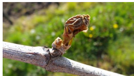
Bourgeon et contre bourgeon gelé le 29/04

Ci-contre des photos de coupe de bourgeons et de dégât en parcelle. Les plantations de ce printemps ont aussi subi des dégâts