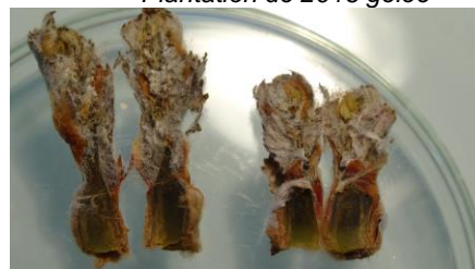
Coupe de bourgeon gelé