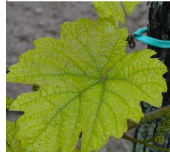
Chlorose ferrique au 23/05

ferrique présentent des jaunissements depuis quelques jours. Les feuilles sont pales avec des nervures vertes.