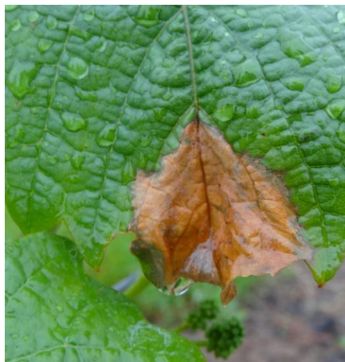
Nécrose de botrytis

De nombreuses taches foliaires, brunes, sectorielles et aux bordures irrégulières sont observables. Elles résultent de contaminations de botrytis liées aux précipitations régulières et abondantes de ce printemps.