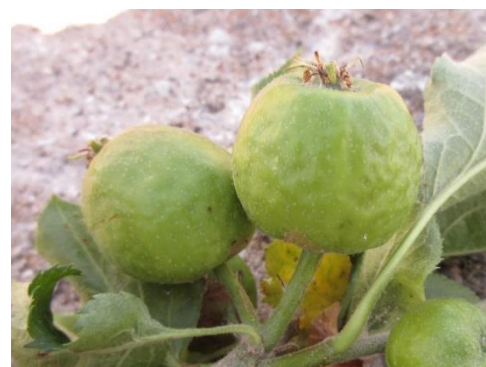
Fruits déformés par les piqûres de puceron cendré

Le puceron vert a également bénéficié de conditions favorables et est fréquent sur les jeunes pousses.