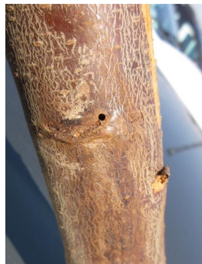
Trous d'entrée de xylébore

Il est possible de mettre en place un piégeage massif avec des plaques engluées rouges et un attractif à base d'alcool en sortie d'hiver. Le vol est terminé à l'heure actuelle. La prophylaxie consiste à éliminer les arbres atteints en les sortant du verger, dès la détection des symptômes.