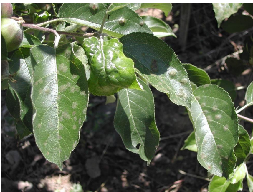
Tavelure sur feuille

Il est primordial d'inspecter l'ensemble des vergers afin de détecter la présence de tache de tavelure pour la dernière fois cette semaine.