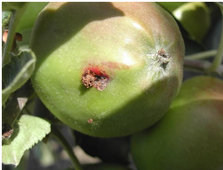
Perforation de carpocapse avec l'auréole rouge et la présence de sciure

A la fin de la première génération prévue entre fin juin et début juillet, il est souhaitable de faire un comptage 1000 fruits dans les parcelles afin d'évaluer les dégâts . Le résultat permet ensuite d'adapter les stratégies de lutte de la seconde génération. Le dépassement du seuil de 3 perforations pour 1000 fruits indique que la pression est importante pour la seconde génération .