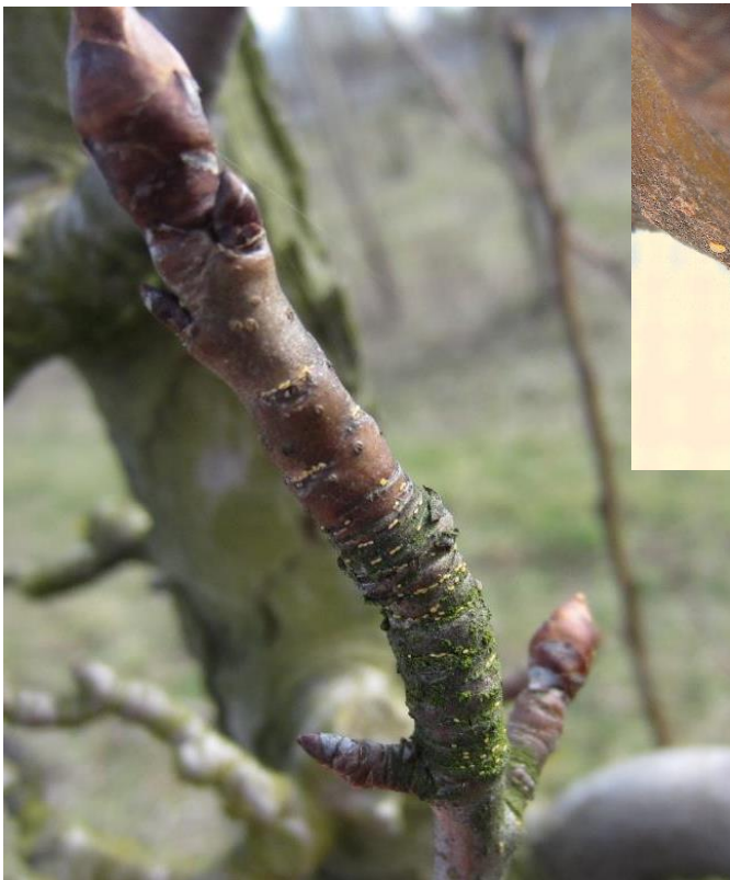
Pontes de psylles (0,8 mm) sur une lambourde

La présence d'œufs de couleur blanche a été observée sur le secteur de Brumath sur une parcelle en fin de semaine dernière. Ce sont des pontes récentes. Dans les autres secteurs, les conditions de brouillard et de givre n'ont pas permis les observations.