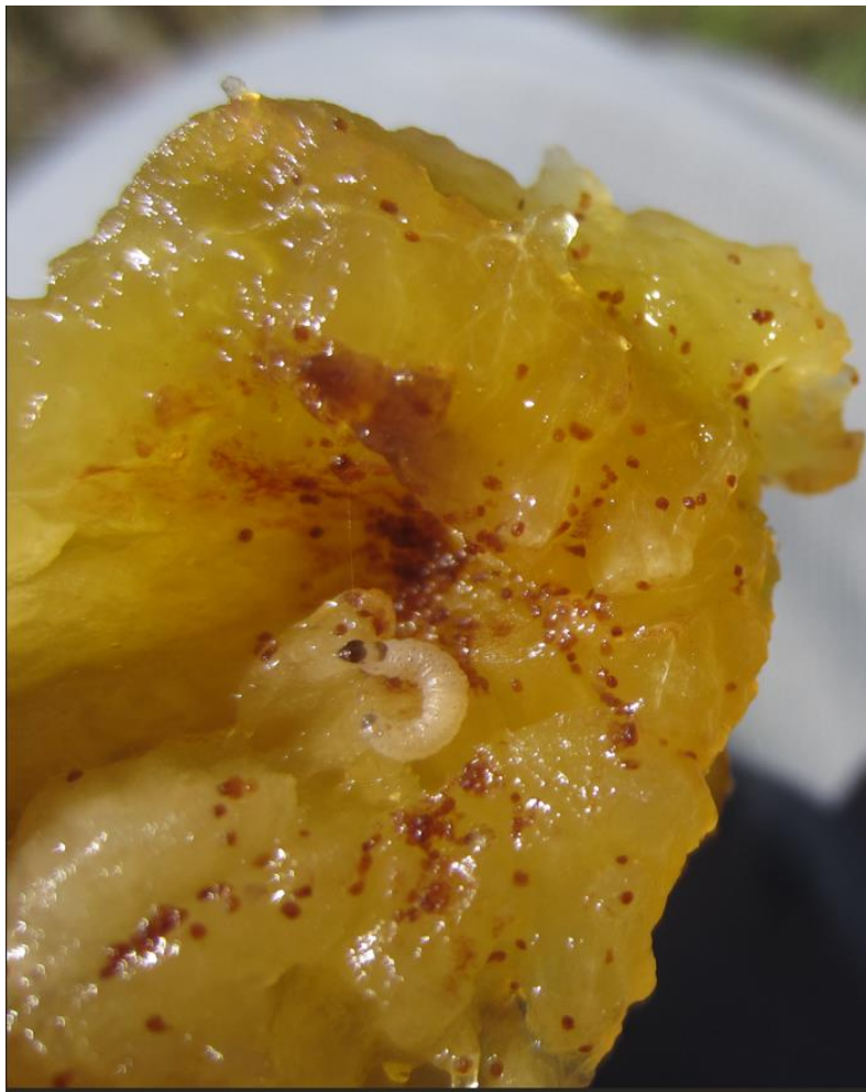
Larve de carpocapse des prunes en mirabelle (FREDON GE)

Les captures ont diminué cette semaine sur le piège de Westhoffen avec 45 captures contre 85 la semaine passée. Le pic de vol est dépassé au sud de Colmar avec seulement 16 papillons cette semaine. Des larves de 5 à 7 mm ont été observées dans les fruits dans une parcelle au sud de Colmar (1% des fruits) ainsi que dans le secteur de Westhoffen.