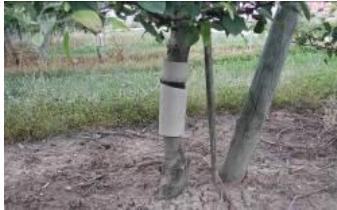
Bande de carton, face ondulée vers le tronc (FREDON GE)

Cette méthode peut également être utilisée dans les zones confusées pour évaluer la pression du carpocapse pour l'année suivante. Il s'agit alors de poser environ 30 bandes-pièges par Ha. Avec une moyenne supérieure de 1 larve par bande-piège, la pression sera jugée importante.