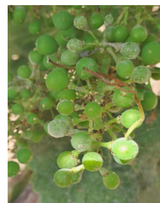
Oïdium sur grappe