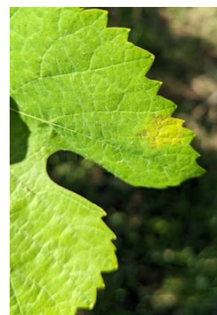
Tache non sporulante