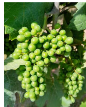
Stade pré fermeture (BBCH 77)

La charge doit être repensée sur les jeunes parcelles en souffrance. L'arrosage des complants et jeunes plantations est à faire pour assurer leur survie.