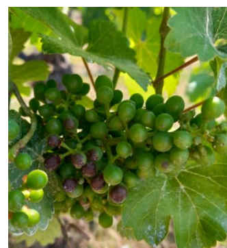
Brûlures sur grappe

Peu nombreuses sont les communes ayant eu des orages entre vendredi soir et dimanche. Le maximum revient à 25 mm sur le vignoble d'Albé.