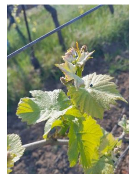
4 feuilles étalées (BBCH 14)

Les nuits fraîches et l'absence d'eau calment le développement.