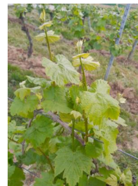
6-7 feuilles étalées (BBCH 16-17)

On note en moyenne 6-7 feuilles étalées (BBCH 16-17) avec une fourchette 5 à 8 feuilles. De rares exceptions présentent près de 10 feuilles en situations bien exposées. Cela représente 2 à 3 feuilles de plus en une semaine et un accroissement net du volume foliaire. Les pampres se sont également fortement développés en une semaine.