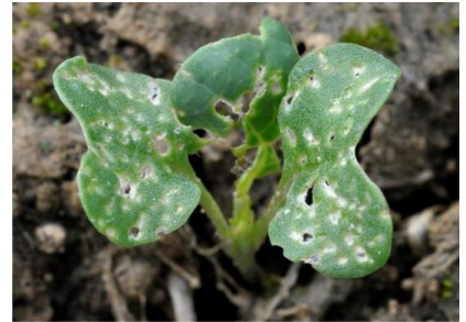
Plus de 25 % de la surface touchée