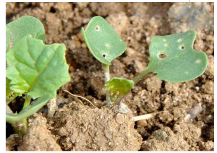
Moins de 25 % de la surface touchée

Le vol est enclenché et les premiers dégâts foliaires sont observés. Si le risque semble faible pour l'instant, il peut évoluer très rapidement avec la poursuite du vol des grosses altises dans les prochains jours. Observer très régulièrement vos parcelles n'ayant pas atteint ou dépassé 4 feuilles.