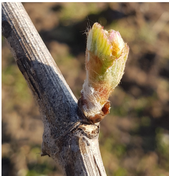
Bourgeon au stade 05 « débourrement »

Une certaine hétérogénéité est observée entre cépages et entre régions, comme habituellement à cette période de la campagne.