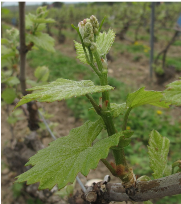
4 feuilles étalées

Après deux semaines de températures fraîches et de stagnation de la phénologie, les températures remontent enfin depuis le week-end dernier.