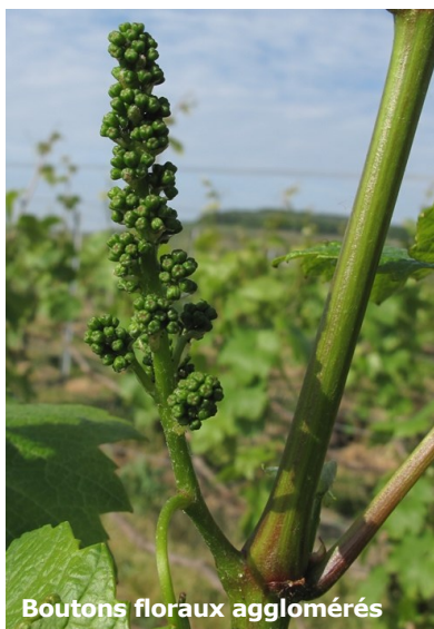
Boutons floraux agglomérés

Avec les températures douces, voire élevées du week-end dernier, la dynamique de pousse est active. Cela va se poursuivre pour la semaine à venir (source : modèle de pousse du Comité Champagne), même si les températures vont baisser légèrement en milieu de semaine.