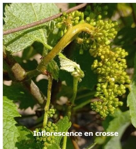
Inflorescence en crosse