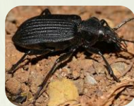
Carabe sp.

Ex : Cicindèles , staphylin , carabes , bousiers , etc.