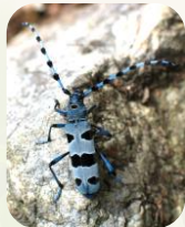
Rosalie des Alpes

Ex : Grand capricorne , Rosalie des Alpes , petite biche , etc.