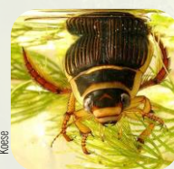
Dytique magné.