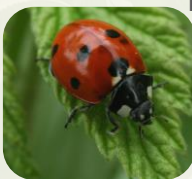
Coccinelle à 7 points.

Ex : Hanneton commun , charançons , chrysomèles , coccinelles , etc.