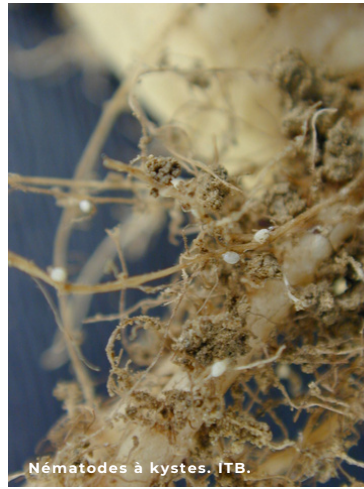
Nématodes à kystes. ITB.

carence magnésienne induite, augmentation de la tare terre, ...). Commercialisées depuis 2004, ces variétés disposent aujourd'hui d'un haut potentiel de rendement en présence mais aussi en absence du nématode. Issues de Beta maritima , elles bloquent le développement d'une partie des nématodes ayant pénétré dans les racines.