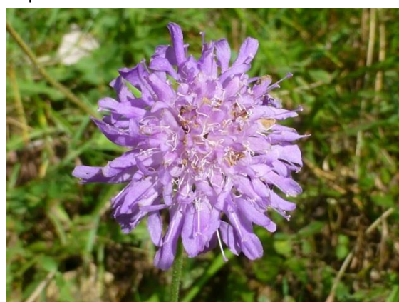
Knautie des champs : Knautia arvensis , Caprifoliaceae