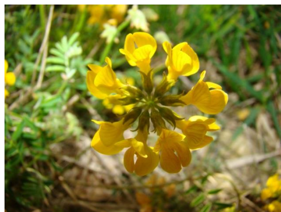
Hippocrépis à toupet : Hippocrepis comosa , Fabaceae