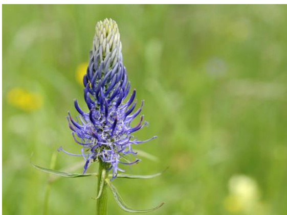
Raiponce en épi : Phyteuma spicatum , Campanulaceae