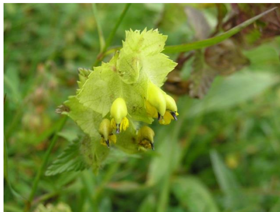
Rhinanthe crête-de-coq : Rhinanthus alectorolophus , Orobanchaceae