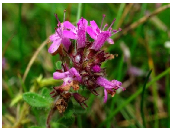
Thym serpolet : Thymus serpyllum , Lamiaceae