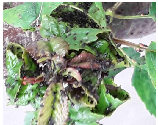
Colonie très importante de pucerons noirs sur cerisier

Les pucerons sont des ravageurs préoccupants pour les cultures. Dans certains, ils conduisent à des déformations de rameaux.