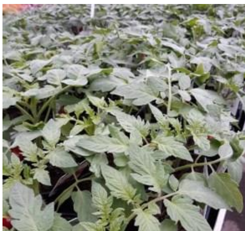
Dernières séries de tomates en production.

Les différentes séries de plants potagers continuent leur croissance. Les plantes sont globalement saines.