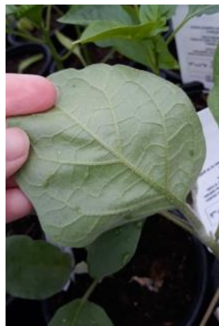
Foyer de pucerons sur la face inférieure de feuille d'aubergine

Comme précédemment, ces foyers peuvent encore être contrôlés par l'apport d'auxiliaires.