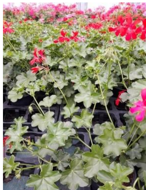
Pélargonium lierre.

Il faut cependant rester vigilant, les thrips peuvent facilement passer des géraniums aux jeunes chrysanthèmes lorsqu'ils arriveront. Le nettoyage des serres permettra d'éviter ce transfert.