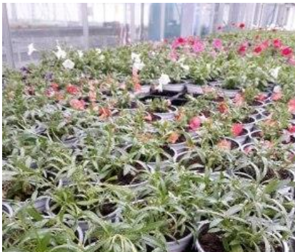
Dernières séries de calibrachoa et pétunias en croissance.

Les cultures sont fleuries et encore présentes en quantité en serres de commercialisation. En production, il reste quelques dernières séries en croissance pour la fin de saison.