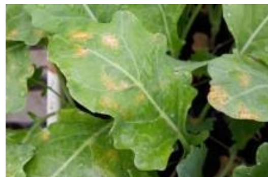
Début de mildiou sur jeunes plants de choux.

Il faut surtout éviter la propagation du mildiou aux autres plants potagers en isolant ou supprimant les plantes trop atteintes.