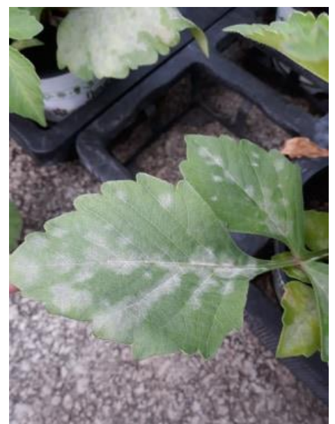
Tâches d'oïdium sur feuillage de dahlia

Les températures se rafraichissent et l'air est humide, ce qui peut favoriser le développement du champignon. Il faut surtout éviter la propagation de l'oïdium en isolant ou supprimant les plantes trop atteintes.