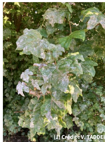
(1) Crédit : V. TADDEI