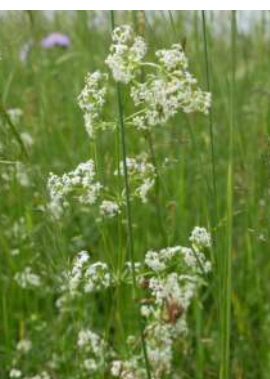
Galium gr mollugo