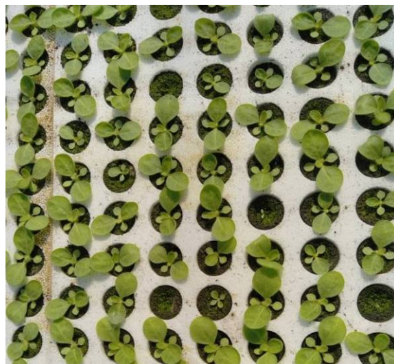
Semis de tabacs en stade Croix

D'une manière générale, l'état sanitaire des plants est satisfaisant et ils se développent correctement depuis le commencement des semis début mars. On remarque la présence de mousses et d'algues sur plateaux à cause d'un manque d'aération des serres à la suite du temps froid pour Fontaines (85) et Amuré (79). A noter pour Proissans (24) que des racines aériennes ont été observées à la suite des amplitudes thermiques de ces derniers jours.