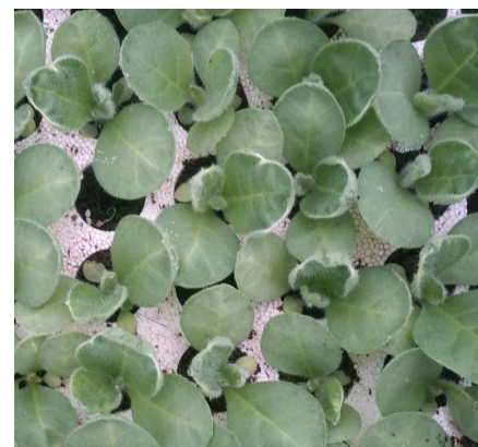
Symptômes des feuilles en cuillères

- Pujol (65) - Baignac (33) - Beauville (47) - Saint-Memmie (51) - Vivonne (86) - Hochfelden (67)