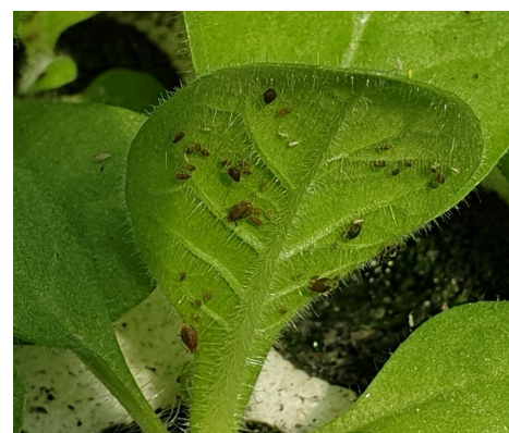
Pucerons sur jeunes plants de semis

En tour de plaine, les pucerons commencent à se développer sur plusieurs secteurs dont Beauville (47) ou on les observe sur 11 ha. On signale également leur faible présence sur 1 ha pour les secteurs de Saint-Pierre-d'Eyraud (24) et de Thuret (63). Des foyers de pucerons sont également présents sur 2 ha dans le secteur de Sanvensa (12). Pour le secteur de Blagnac (33) on note des traces sur 5 ha avec des signalements de quelques pucerons ailés. Des colonies conséquentes sur une grande partie des semis sont signalées dans le secteur du Puch-d'Agenais (47) et de Beauville (47).