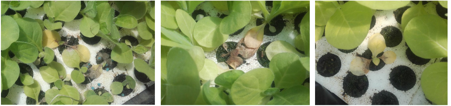
Dégâts de botrytis cinerea sur plants de semis de tabacs