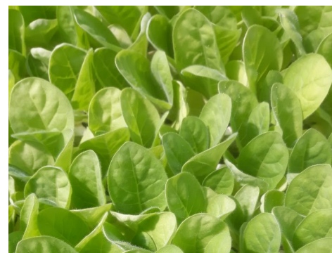
Tabac de fin avril ayant subi des températures froides et dégâts de froid

On observe également quelques dégâts de gel sur les entrées des serres et les bordures extérieures pour la zone de Saint-Memmie (51) avec de la fonte des semis peut être dûe à des voiles de forçage restés plus longtemps que prévu. Dans la zone de Sanvensa (12), les plants sont prêts à être plantés avec un début de pourriture liée au traitement anti-limaces, ainsi que la présence d' Olpidium .