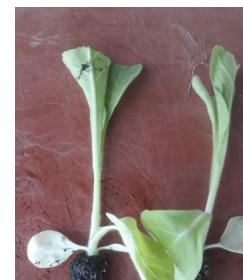
1 er faucillage (à gauche), stade faucillage (au milieu) et tabac faucillé fin avril (à droite)