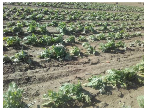
Dégâts de grêle et des eaux sur Tabacs

Ce BSV a été rédigé avec des informations collectées sur 11 parcelles de références et sur 798 ha pour les tours de plaine.