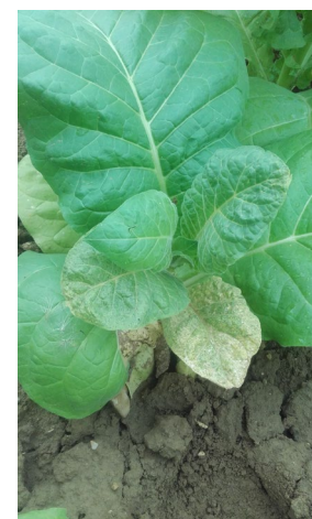
Viroses AMV (a gauche et au centre) et Virus PVY (à droite) sur le secteur de Sanvensa (12)