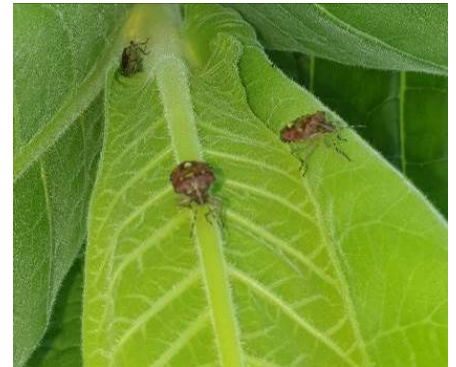
Punaises et leurs dégâts sur plant de tabac