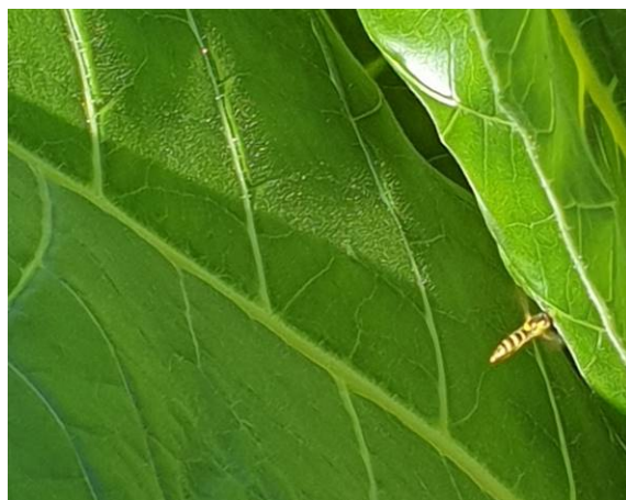
Syrphes sur feuilles de tabacs

On observe les premières apparitions des chrysopes et hémérobes pour ce BSV, où ils sont actifs sur 15 ha avec des signalements de leur présence sur 25 ha pour le secteur de Vivonne (86). Enfin sur 20 ha ils régulent les pucerons sur le secteur de Chemillé (49).