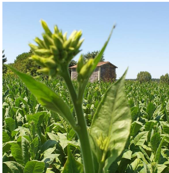
Tabac Virginie au stade montaison (à gauche) et dégagement bouton floral avant inhibition (à droite)