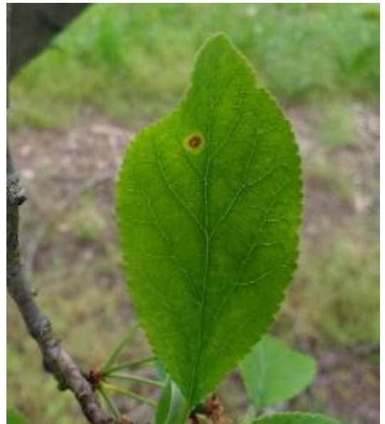
Criblure à corynéum sur quetchier

Les conditions actuelles sont favorables aux contaminations. D'autres dégâts pourraient apparaître.