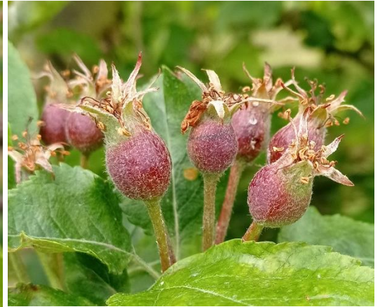
Stade I sur pommier