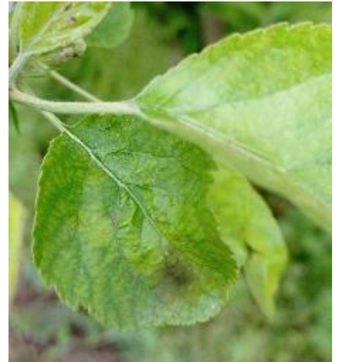
Tache de tavelure sur feuille

Les pluies ces derniers jours ont été entrecoupées de périodes sèches et les températures étaient basses. Le risque de contamination est donc faible