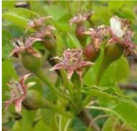
Stade J sur poirier