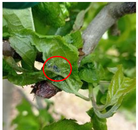
Foyer de pucerons cendrés

Le risque vis-à-vis du puceron cendré reste élevé.