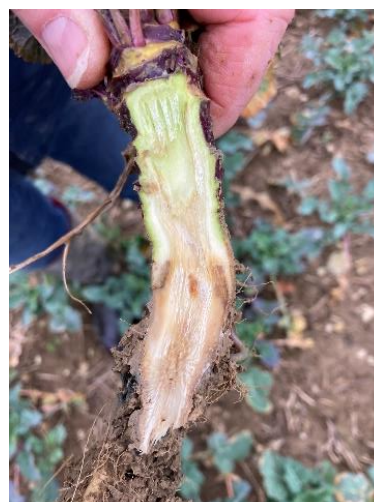
Pivot de colza pourri par l'excès d'eau (Soufflet Agriculture, février 2024)