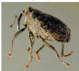
Charançon de la tige du COLZA