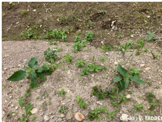
Daturas en croissance

Les premiers daturas levés sont en croissance et d'autres continuent de lever. Ils peuvent avoir des levées étalées jusque fin août. A cette période, la tige est glabre, arrondie. Elle se ramifie et se solidifie. Les feuilles sont irrégulièrement dentées avec un long pétiole. Une odeur peu agréable s'en dégage. Plus tard durant le mois de juillet, des fleurs blanches solitaires de grande taille et en forme d'entonnoir apparaîtront à l'aisselle des feuilles.