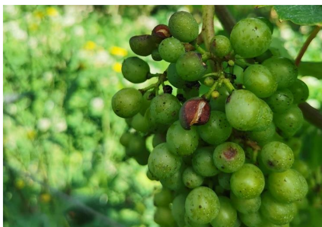
Dégâts de grêle Moselle