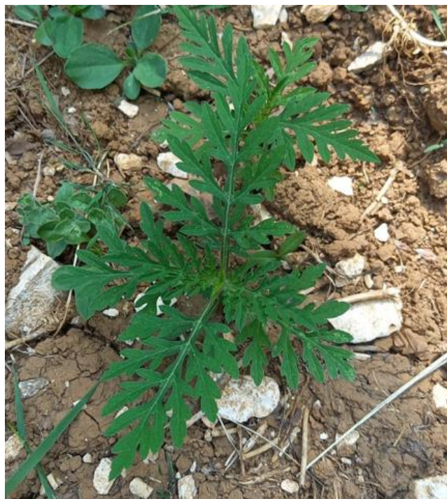
Ambrosies en croissance (FREDON Grand Est)

Les premières ambrosies levées sont en croissance et d'autres continuent de lever. Elles peuvent avoir des levées étalées jusque fin aout. A cette période, elle est facilement reconnaissable par ses feuilles larges, très découpées , du même vert sur chaque face et très peu odorantes ce qui permet de la différencier des armoises communes. Elles sont opposées à la base des tiges.