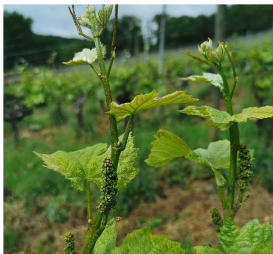
Boutons floraux agglomérés (BBCH15)

Les stades observés varient entre boutons floraux agglomérés (BBCH15) et boutons floraux séparés (BBCH17). La majorité est au stade boutons floraux agglomérés (BBCH15).