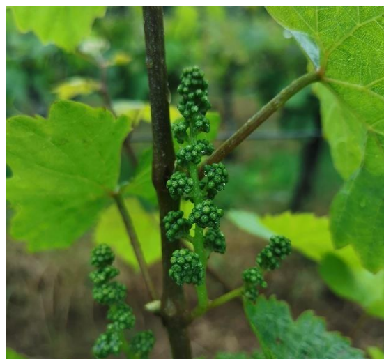
Boutons floraux séparés (BBCH17)