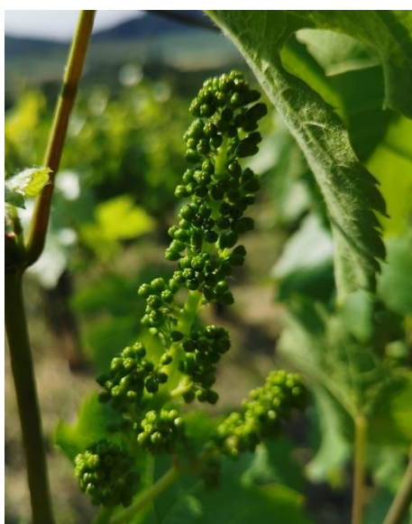
Stade H17 (BBCH57) « boutons floraux séparés »

La floraison débute sur le vignoble Lorrain. Les stades varient entre H17 (BBCH57) « boutons floraux séparés » et le stade I20 (BBCH61) « début floraison ». En 2022, la floraison avait démarré au 1 er juin.