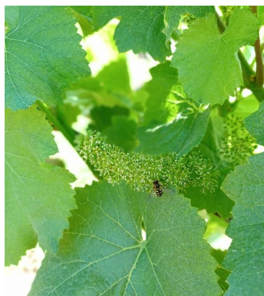
Stade I20 (BBCH61) « début floraison »