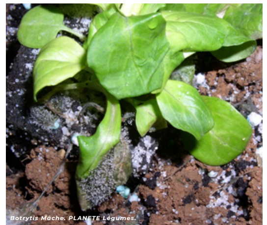
Botrytis Mâche. PLANETE Légumes.

>> Cependant, fait est de constater que le bicarbonate est surtout efficace sur deux maladies fongiques en maraîchage, à savoir l' oïdium et le botrytis . C'est également le cas de la tavelure qui apparaît moins problématique au sein de la filière légumes.