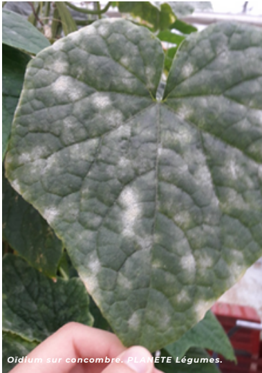
Oïdium sur concombre. PLANETE Légumes.

>> Les bicarbonates ou hydrogénocarbonates de potassium et de sodium (soude) sont des fongicides de contact multisites. C'est-à-dire que ces substances vont agir à plusieurs niveaux sur les cellules des champignons, provoquant le dessèchement de la partie végétative du champignon (les hyphes) et donc inhiber leur germination.