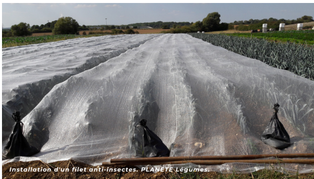
Installation d'un filet anti-insectes. PLANETE Légumes.