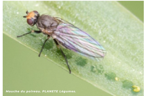
Mouche du poireau. PLANETE Légumes.

>> En cours de culture, la pose de ces filets pendant la période de vol est la méthode de protection principale. Il s'agit la plupart du temps de toiles tissées dont la taille de mailles et le grammage varient en fonction de la culture à protéger et du ravageur ciblé.