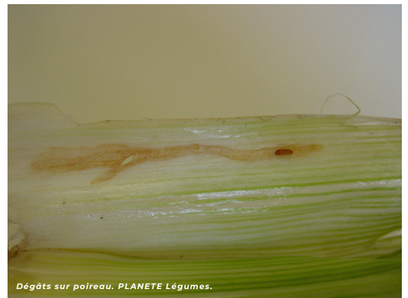
Dégâts sur poireau. PLANETE Légumes.