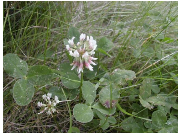
Trèfle nain blanc : Trifolium repens , Fabaceae