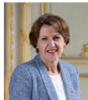
Annie Genevard, ministre de l'Agriculture, de l'Agro-alimentaire et de la Souveraineté alimentaire